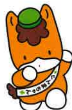
群馬県のマスコット 「ぐんまちゃん」 2019-100036

リレー・フォー・ライフは、がんに立ち向かう方々の勇気を称え、がん患者や家族、友人、支援者と共に地域一丸となってがん征圧を目指すチャリティー活動です。リレーイベント参加者は共に歩き語らうことで、がんへの理解が深まるとともに、あきらめない勇気、生きる希望を感じていただけたと思います。群馬県では7回目の開催となります。ぜひ会場においでください。