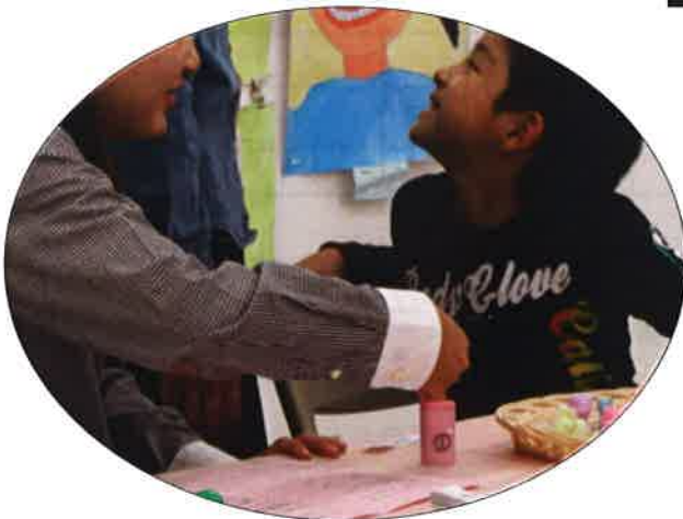
楽しそうな指印象