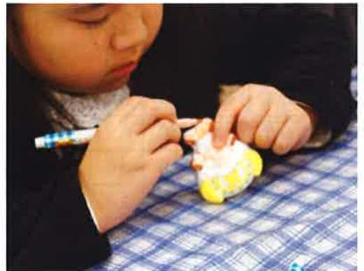
キャラクターのカラーリング

このイベントにより歯科衛生士、歯科技工士の職業をより多くの人達にアピールする事が出来たと思います。