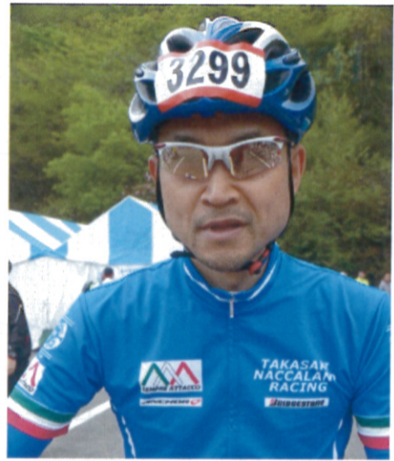
ゴールの休憩地で