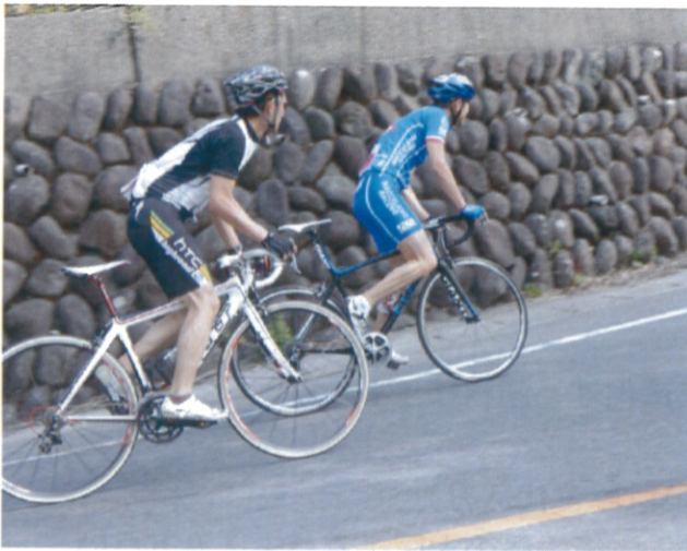
難所での競い合いは逃げ切る

頂上付近計測地点まで100m、最後の難所のカーブでの力強さと競り合いには大きな声援が送られていた。